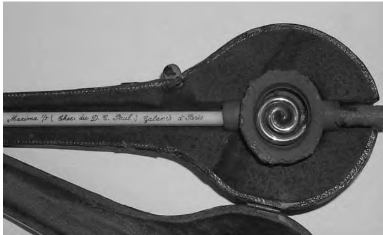
FOTOGRAFIA 1. Termòmetre del doctor Paul, fabricat per Galante a París, ca. 1912. Cubeta de mercuri en espiral amb protecció de cautxú (inv. 278).

Alguns dels instruments de la col·lecció de l'MHM