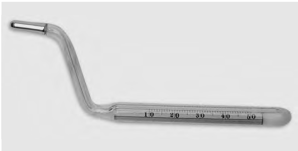
FOTOGRAFIA 2. Termòmetre per a prendre temperatures rectals, de fabricació alemanya, ca. 1910. Escala termomètrica manuscrita en paper dins del tub (inv. G-48-3).